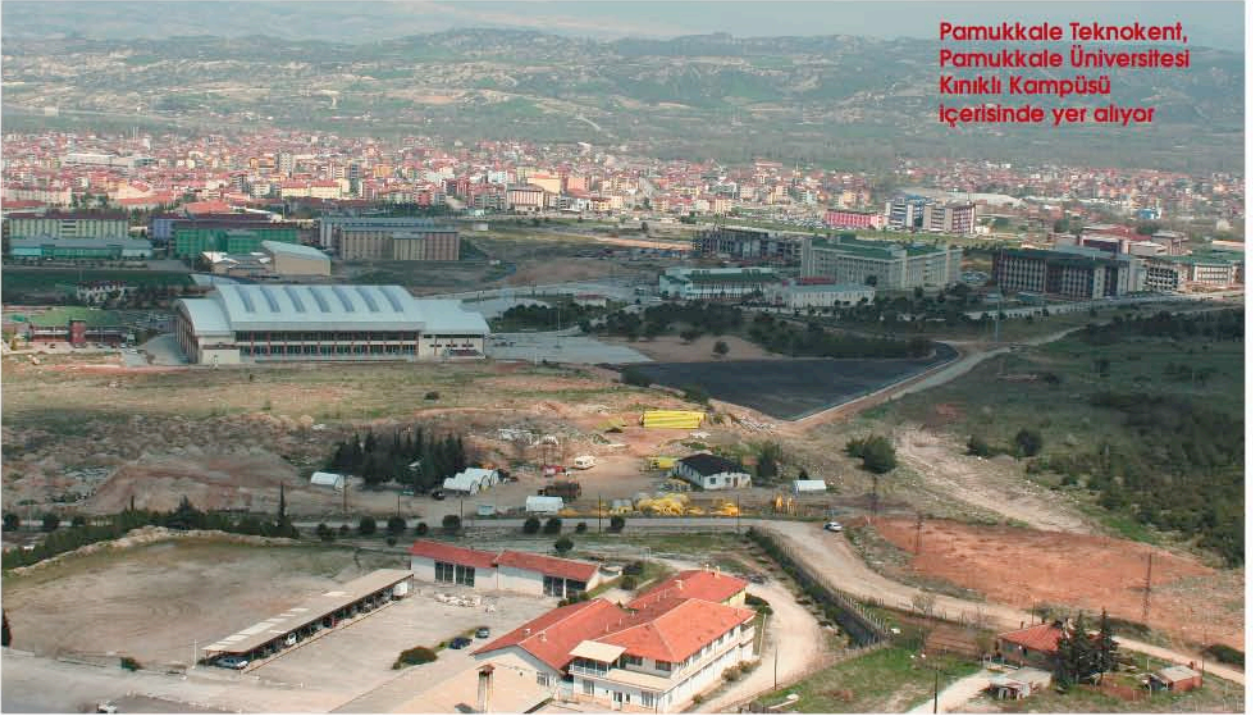
Pamukkale Teknokent, Pamukkale Üniversitesi Kınıklı Kampüsü içerisinde yer alıyor

Pamukkale Teknokent içinde sanayinin kullanımına uygun olarak tasarlanmış, bilgisayar, fizik, kimya, biyoloji, elektrik-elektronik, tıp/mikrobiyoloji, gıda, inşaat, makine, jeoloji ve tekstil laboratuvarları yer alıyor.