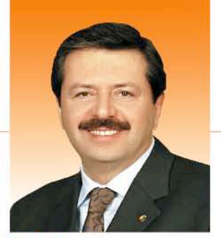
M. Rifat Hisarcıklıoğlu TOBB Başkanı