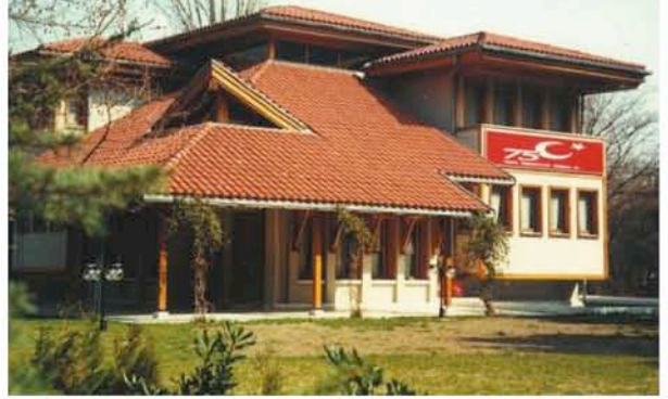
BUSİAD, üyelerine Bursa Kültürpark'ta bulunan binasında hizmet veriyor.